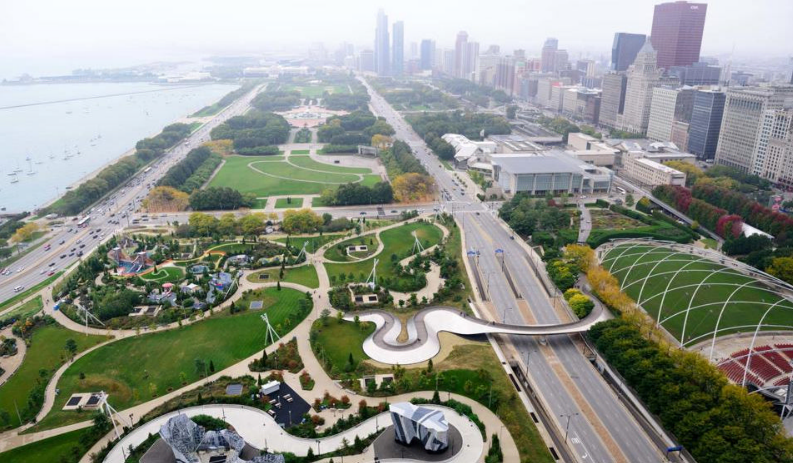
Chicago set fra oven