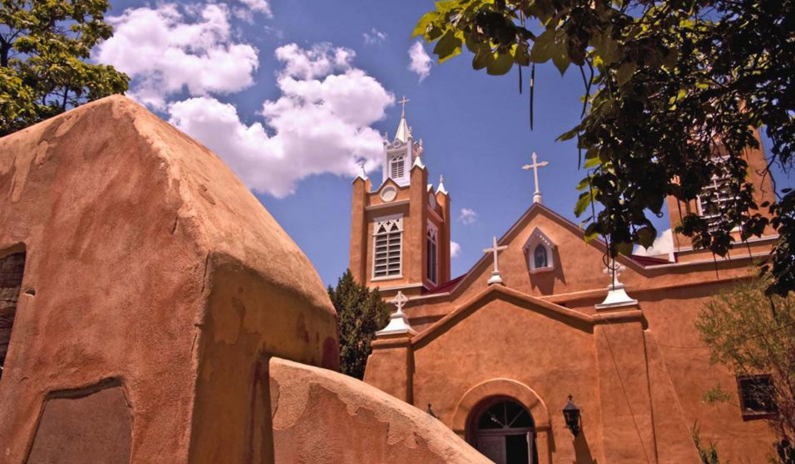
Historisk kirke i Albuquerque, New Mexico