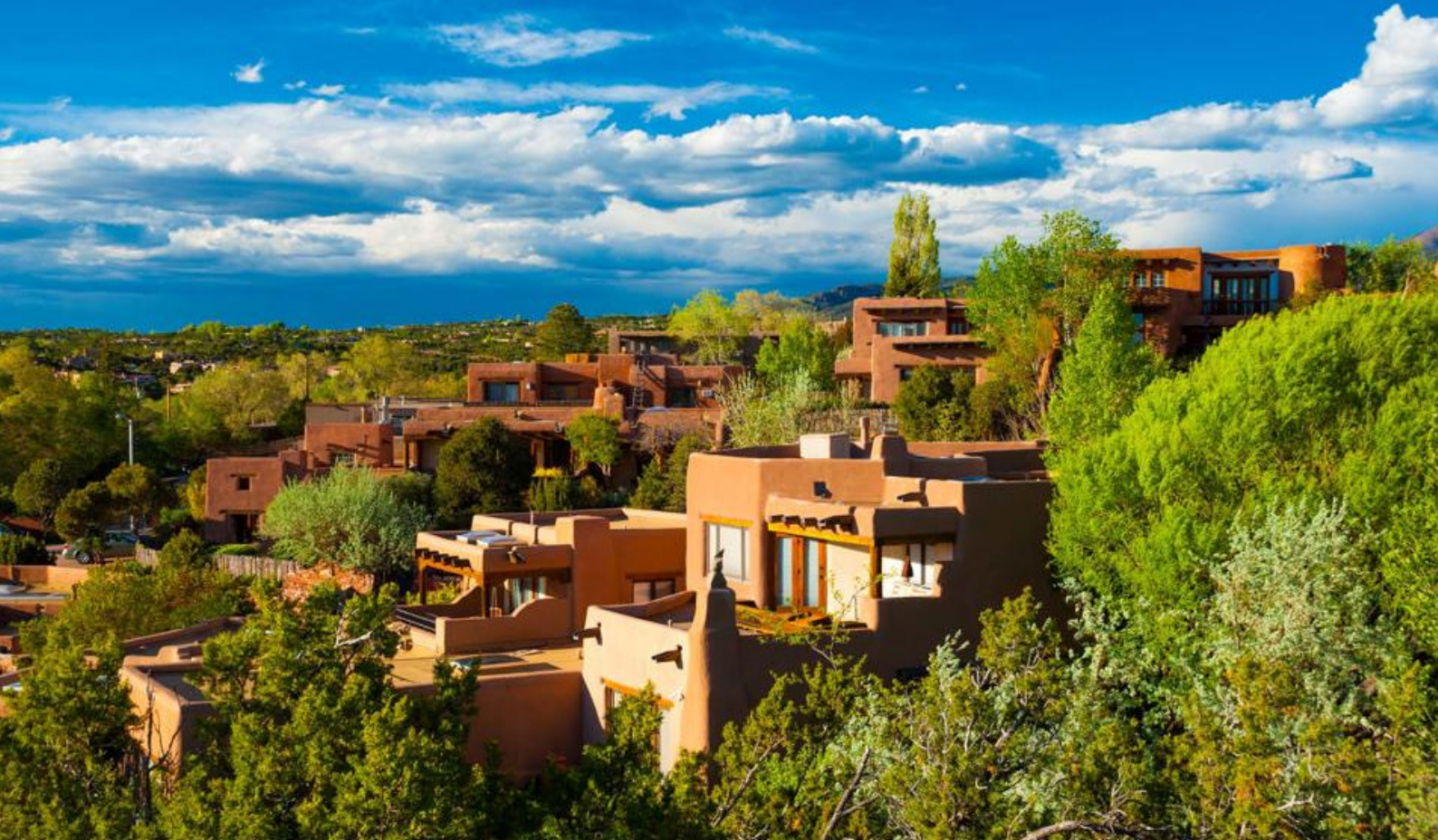
Hyggelige Santa Fe

igennem her i 1926 og fortsatte mod vest. Den berømte St. Louis Gateway Arch er opsat som et symbol for erobringen af Vesten. I begyndelsen af 1900-tallet fik St. Louis international anerkendelse for at være vært ved bl.a. World's Fair, OL og den første internationale Ballon Race.