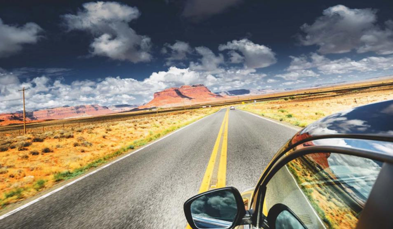
Kar-selv-ferie langs Route 66

som hævdes og være det største levende kvægmarked i verden. Kvægauktionerne er åbne for offentligheden hele dagen mandag og tirsdag. Besøg evt. National Cowboy Hall of Fame & Western Heritage Center. Her er historie og kulturen skildret i en bred vifte af forskellige udstillingsgenstande i dette store museum. Malerier af kendte kunstnere som Charles Russel og Frederic Remington er nogle af højdepunkterne.