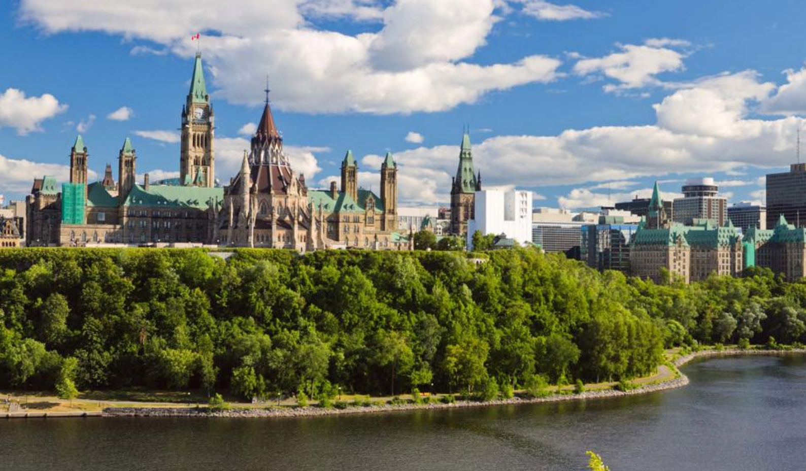
Ottawa, hovedstaden i Canada

gennem de maleriske byer i regionen Prince Edward.