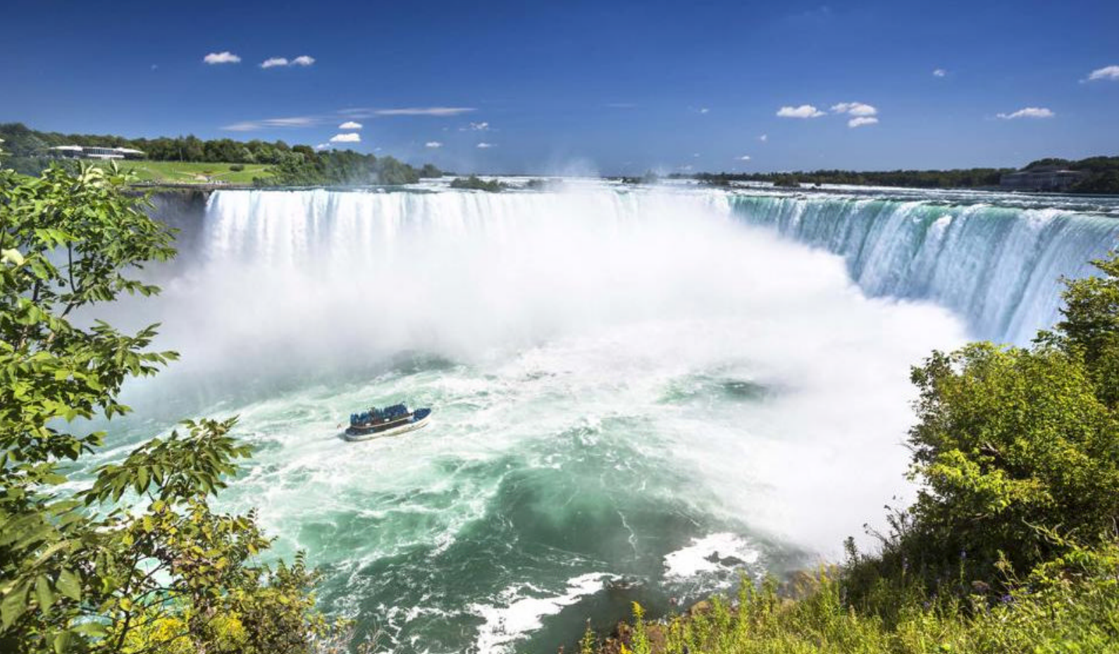
Imponerende Niagara Falls

finder I Lions Lookout Park eller Muskoka Pioneer Village.